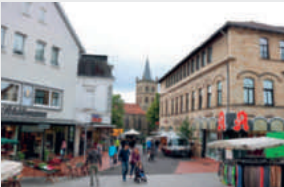
Ibbenbüren Innenstadt, Oberer Markt mit Blick auf die Christuskirche