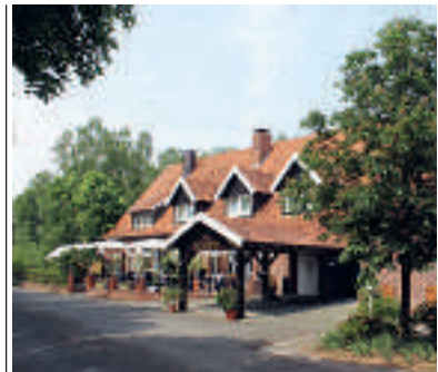
6 Hotel Landgasthaus Wermelt, Greven