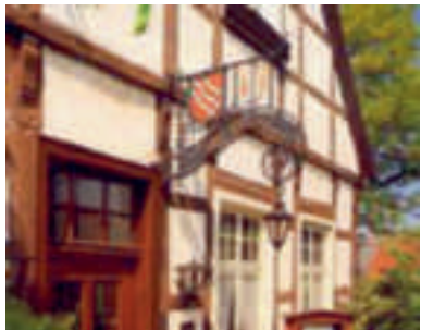
7 Hotel & Gastronomie Mühlenkamp, Oelde