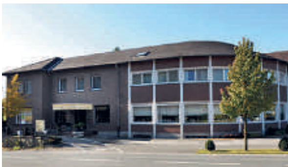
10 Hotel-Restaurant Zur Windmühle, Beckum-Höxberg

Die moderne Hochschulstadt liegt direkt am malerischen Teutoburger Wald und ist daher ein wahres Paradies für Wanderer, Biker, Kletterfans und Erholungssuchende. Die sportliche Ausdauer wird dabei mit atemberaubenden Panoramablickern über die herrliche Landschaft belohnt. Absolutes Highlight der über 800 Jahre alten Stadt ist die mittelalterliche Sparrenburg. Jedes Jahr im Sommer lockt die gewaltige Festungsanlage mit einem großen Spektakel rund um Handwerksmeister, Gaukler und Ritter tausende Gäste an. Und auch Kunstinteressierte kommen in der ostwestfälische Metropole voll auf ihre Kosten. 15 außergewöhnliche Museen bieten überregional beachtete Sonderausstellungen, faszinierende Architektur und kostbare Gemälde. Vor allem ein Besuch der Kunsthalle ist ein absolutes Pflichtprogramm bei einem Aufenthalt in Bielefeld.