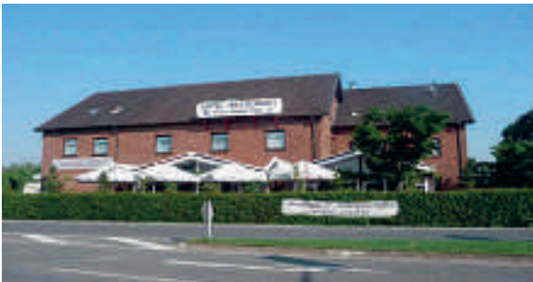
6 Hotel-Restaurant Haus Niederrhein, Moers