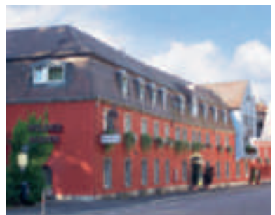
16 Hotel Wilder Mann, Aschaffenburg

Lassen Sie Ihren Gastgeber wissen, dass Sie gerne mit Autobahn-Guide reisen.