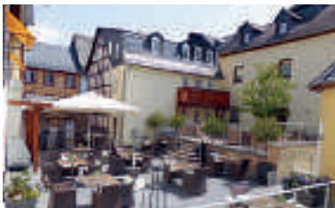
2 Ringhotel Nassau-Oranien, Hadamar

11 D-63303 DREIEICH-GÖTZENHAIN A 661 ab Ausfahrt 19 Dreieich ca. 2 km und A 5 ab Ausfahrt 24 Langen/Mörfelden ca. 8 km Hotel Krone ☆☆☆ 39 B, EZ € 54,- bis 61,-, DZ € 74,- bis 82,-, Appartements ab € 90,-, Raucher-Zi, Wochen- und Monatspreise auf Anfrage, inkl. Frühstück, alle Zi mit Du, WC, TV und WLAN, Lift, regionale Küche, ☎, ☎, P, Wallstraße 2, @, www.hotel-krone-dreieich.de, ☎ +49 6103 84115, 81451, Fax 88970.