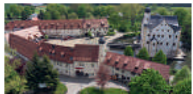
13 Schlosshotel Wasserschloss Klaffenbach, Chemnitz