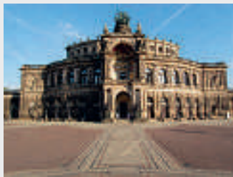
Semperoper in Dresden

Über 50 Museen, mehr als 35 Theater, eine faszinierende Altstadt, berühmte Bauwerke aus zahlreichen Epochen und ein lebendiges Szeneviertel. Dresden ist eine Kunst- und Kulturstadt von Weltrang. Vielfältige Großveranstaltungen, attraktive Ausflugsziele und spektakuläre Sehenswürdigkeiten ziehen jedes Jahr viele Gäste aus dem In- und Ausland an, stadtnahe Erholungsgebiete laden zu Wanderungen oder Radtouren entlang der Elbe oder durch die herrliche Natur des Elbsandsteingebirges ein. Beim Spaziergang durch die Altstadt bieten traditionsreiche Gaststätten, Restaurants, Kneipen und Bars Genuss, Vergnügen und Kurzweil. Residenzschloss, Zwinger, Frauenkirche und Semperoper bilden ein einzigartiges Ensemble von unschätzbarem historischem Wert. Shopping-Fans kommen am Altmarkt oder an der Prager Straße voll auf ihre Kosten. Große Einkaufszentren und ein vielseitiger Einzelhandel locken mit modischer Kleidung, Kunst, Handwerkswaren und so mancher kulinarischen Verführung. So ist dann auch der Besuch des historischen Milchladens der Pfunds Molkerei bei jeder Dresdenreise ein absolutes Pflichtprogramm.