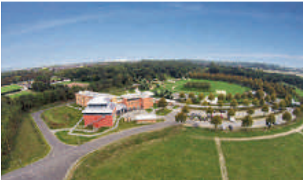
15 JUFA Hotel, Jülich

Hotel-Restaurant Zur Heide und ruhig gelegenes Gästehaus ☆☆☆ 52 B, EZ € 69,- bis 89,-, DZ € 89,- bis 109,-, 3-Bett-Zi ab € 109,-, 3 Studios mit Küchenzeile als EZ, inkl. Frühstücksbuffet, Zi mit Bad oder Du, WC, ☎, TV, Radio und kostenfreiem WLAN, 120 Sitzplätze, Terrasse, ☎, ☎, ☎, P, Raafstraße 76-80, hotelzurheide@aol.com, www.Hotel-Zur-Heide-Aachen.de, ☎ +49 2408 92526-0, Fax 6268.