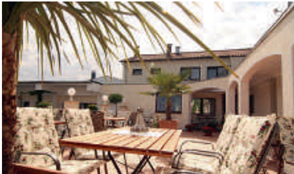
4 Landhotel-Restaurant „Bergischer Hof“, Overath-Marialinden

8 D-50829 KÖLN A 1 ab Ausfahrt 102 Köln-Bocklemünd → Köln ca. 2 km Hotel Wilms ★☆☆ familiengeführtes Hotel am Stadtrand, 20 Zi, EZ ab € 49,-, DZ ab € 79,-, 3-Bett-Zi ab € 89,-, exkl. Frühstück, alle Zi mit Du, WC, TV und kostenfreiem WLAN, nahe an Haltestelle zur Innenstadt, ☑, EC, ☎ auf Anfrage, Grovenbroicher Str. 16, @, www.hotel-wilms.de, ☎ +49 221 9500950, Fax 5003236.