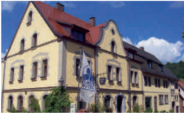
5 Flair-Hotel „Die Post“, Schillingsfürst

7 D-91555 FEUCHTWANGEN A 6 ab Ausfahrt 49 Feuchtwangen-Nord und A 7 ab Ausfahrt 111 Feuchtwangen je 4 km Gasthaus Sindel-Buckel mit Karpfenhotel ☆☆☆ 34 B, EZ € 53,- bis 66,-, DZ € 73,- bis 86,-, inkl. Frühstücksbuffet, alle Zi mit Bad/Du, WC, TV und Internet, sehr gute, regionale Küche mit Fisch, Wild, Geflügel, Lamm, vegetarisch, großer Biergarten, Wintergarten, Räume für 40 bis 120 Personen, ☑, ☑, P, Spitalstr. 28, info@sindel-buckel.de, www.sindel-buckel.de, ☎ +49 9852 2594, Fax 3462.