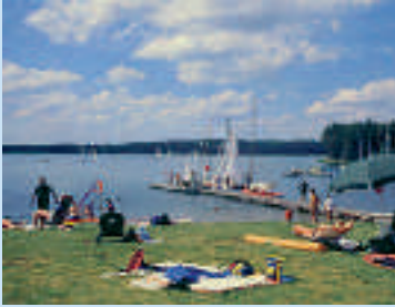
Badespaß am Rothsee