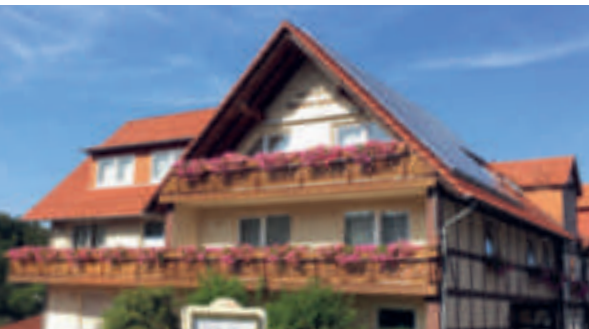
6 Gasthaus Brauner Hirsch, Hann. Münden-Laubach

FLUX - Biohotel im Werratal ☆☆☆☆ 80 B, EZ ab € 79,-, DZ ab € 99,-, Nichtraucher-Zi, inkl. Frühstück, alle Zi mit Du, WC, Fön, ☎, TV, Minibar und WLAN, Bio-Restaurant mit regionaler Frischküche, Tagungsräume bis 80 Personen, Terrasse, ☎, ☎, ☎, großer P, Buschweg 40, info@flux-biohotel.de, www.flux-biohotel.de, ☎ +49 5541 998-0, Fax 998-140.