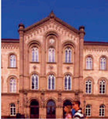
Auditorium maximum, Göttingen

Langeweile ist in Göttingen ein Fremdwort. Das Kultur- und Freizeitangebot ist vielfältig und lässt keinen Wunsch offen. Egal ob Theater- und Konzertveranstaltungen, Museen, Shopping-Touren oder ein Besuch in geselligen Kneipen, Bars und Cafés: in der Universitätsstadt erwarten die Besucher unzählige Möglichkeiten für eine abwechslungsreiche Freizeitgestaltung. Im Rahmen einer Nachinventarisierung der ausgewiesenen