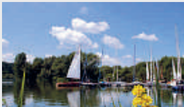
Breitenbacher Seen in Bebra mit Wohnmobilstellplatz

Entdecken Sie entlang der Fulda eine nordhessische Urlaubs- und Erholungsregion mit einer unverwechselbaren Natur, einer typisch nordhessischen Gastlichkeit, vielen kulturellen Sehenswürdigkeiten sowie einem vielfältigen Sport- und Freizeitangebot. Ob für einen Abstecher von der Autobahn oder einen Kurzurlaub – ein Besuch ist in jedem Fall lohnenswert!