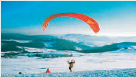
Paragliding auf dem „Berg der Segelflieger“

Eingebettet in die Rhön liegt Gersfeld, im Landkreis Fulda in Osthessen. Als anerkannter Heilklimatische Kurort und Kneipp-Heilbad ist Gersfeld Ausgangspunkt von Wanderungen durch das Biosphärenreservat Rhön und des Wintersports. Fünf Kilometer nördlich von Gersfeld liegt die Wasserkuppe, der mit 950 Meter höchste Berg der Rhön und zeitgleich die höchste Erhebung in Hessen. Dort befindet sich das Deutsche Segelflugmuseum. Auf dem Berg, der überregional als „Wiege des Segelflugs“ bekannt ist, entspringt die Fulda. Weitere 30 Bäche haben dort ihren Ursprung. Von der Gipfelregion fällt der Blick über die Rhönlandschaft und bei guter Sicht unter anderem bis zu Hohem Meißner, Rothaargebirge und Taunus. Auf der Wasserkuppe existieren heute ein Flugzentrum für Hängegleiter, Paragliding und Snowkiting, ein Segelflugmuseum, eine Radarkuppel namens Radom Wasserkuppe, ein Informationszentrum zum Biosphärenreservat Rhön (Groenhoff-Haus), Hotels und Restaurants, ein Zeltplatz, Souvenirläden, eine Sommerrodelbahn, Skilifte und eine Jugendbildungsstätte.