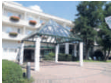
20 Hotel Restaurant Gersfelder Hof, Gersfeld