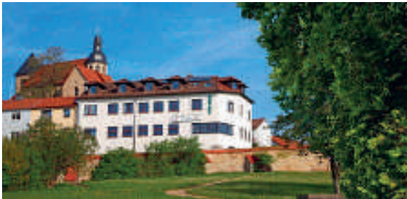
16 Gasthof Altes Casino, Petersberg

Gasthof-Pension Lenk „Zum Auerhahn“ ★☆☆☆ ruhige Lage in Ortsmitte, 18 B, EZ € 40,-, DZ € 68,-, Familien-Zi, inkl. Frühstück, alle Zi mit Du, WC, Fön, ☎, Flat-TV und WLAN, neue Bäder, gutbürgerliche Küche, Biergarten, Räume für 20–45 Personen, Zweiradfahrer willkommen, ☎, Untergasse 1, @, www.lenk-schlitz.de, ☎ +49 6642 5031, Fax 5034.