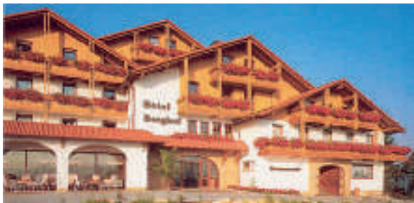
17 Hotel-Restaurant Berghof, Petersberg-Almendorf

Sie erhalten Autobahn-Guide im Buchhandel oder unter www.autobahn-guide.com