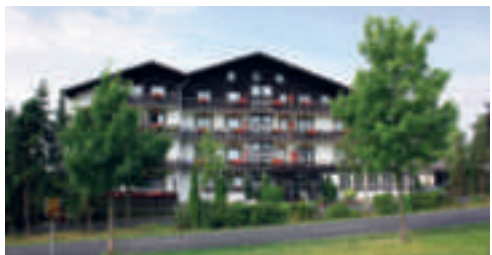
25 Hotel Rhön-Hof, Oberleichtersheim